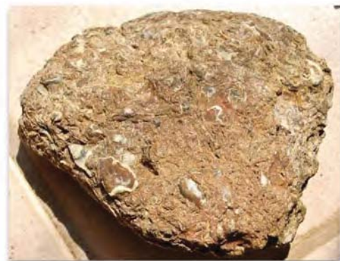
Et af dagens fund: et stykke "forstenet havbund", som ligner en Katholmblok