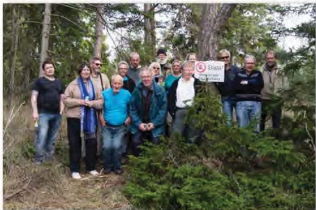
Endelig adgang til Tofta Skjutfält – alle slap dog levende fra mødet med skydebanen.

2.5. Nedpakning, rengøring og sejlads i magsvejr til fastlandet fik vi overstået først på dagen, og så hed næste stop Ignaberga Kalkbrud, som ikke længere er noget stort sted. På en hurtig rundtur fangede vi dog en håndfuld belemnitter og lidt muslinger. Nok til at holde de værste fossilabstinenser nede på resten af hjemturen.