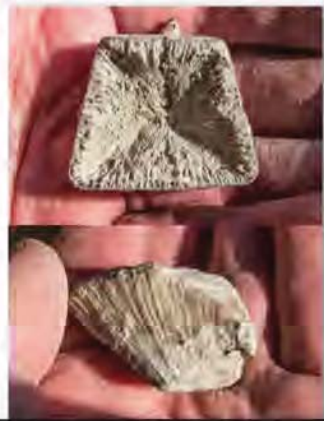
4-kant koral, Goniophyllum pyramidale