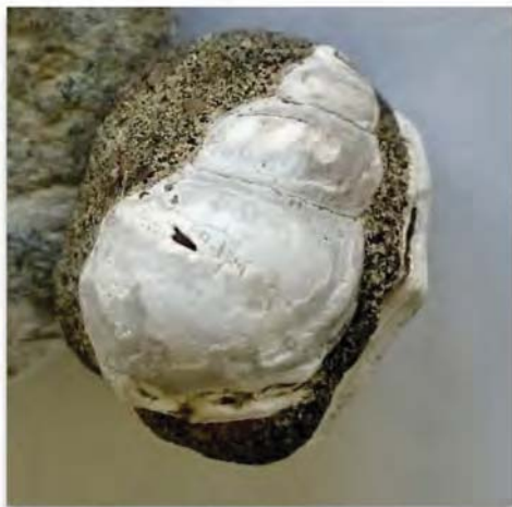
En stor pelikanfodssnegl, Drepanocheilus speciosus, fra Øvre Oligocæn

Den vellykkede tur sluttede, som den begyndte: i pragtfuldt sommervejr, så det kan man da kalde en rigtig sommerudflugt!