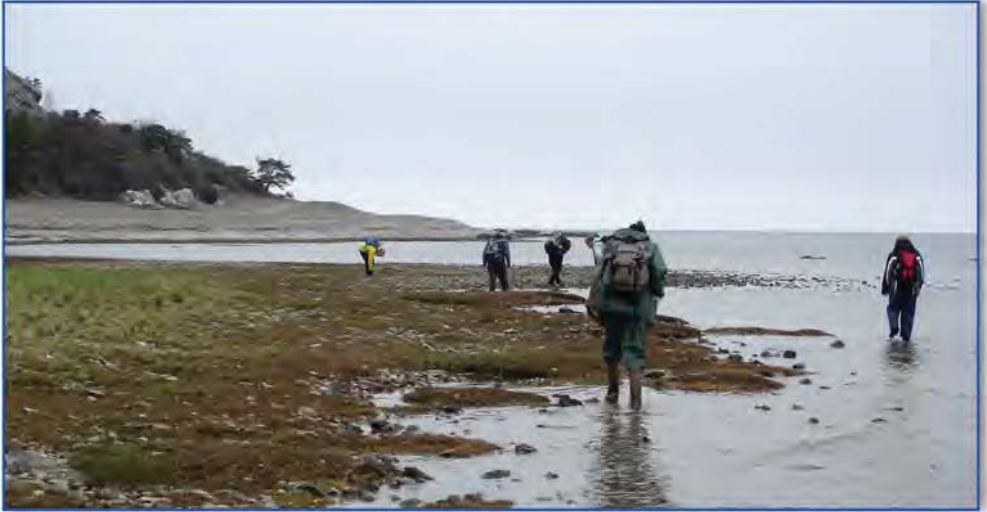
Endelig fremme ved stranden nær Grogarnshuvud.

te gennem Roma med Kungsgården og klosterruinen, men også det lokale whiskydestilleri. Ad kringlede grusveje, hvor forrevne fyr og enebær prydede landskabet, snoede bilerne sig ned fra det 32 m høje Grogarnsberget til stranden.